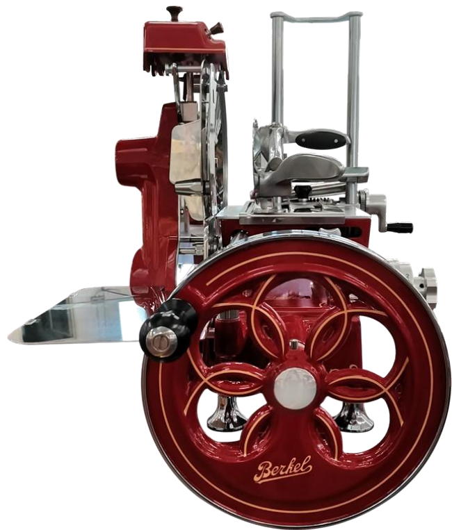
Volano B2 Rossa